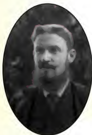
Sir George Bernard Shaw